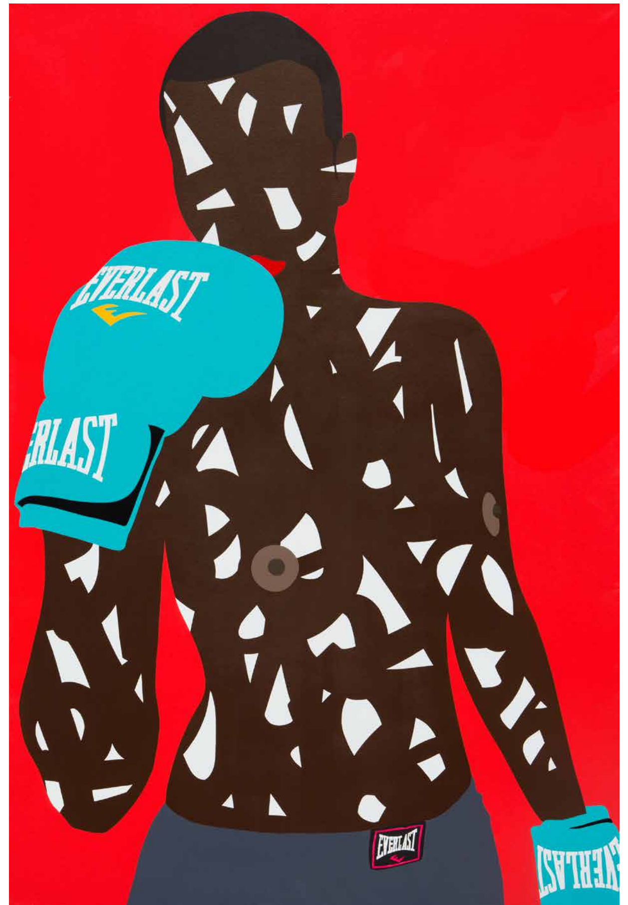
Float like a butterfly, sting like a bee 210 x 140,5 cm